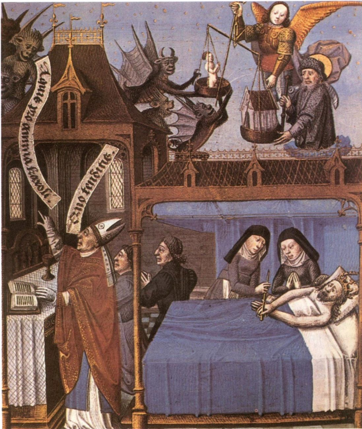
La muerte de Carlomagno, acaecida a principios del año 814 (miniatura del siglo XV, Museo de Chantilly, París)

tó en Baviera, fue proclamado rey de Germania en Francfort (887) y recibió la dignidad imperial en 896. A su muerte (899) el reino fue repartido entre sus hijos, de hecho ya asociados al poder en vida de Arnulfo: Zwentiboldo obtuvo la Lorena y Luis IV el Niño reinó en Germania hasta su muerte (991), en que se extinguió la dinastía y el poder pasó a la Casa de Sajonia.