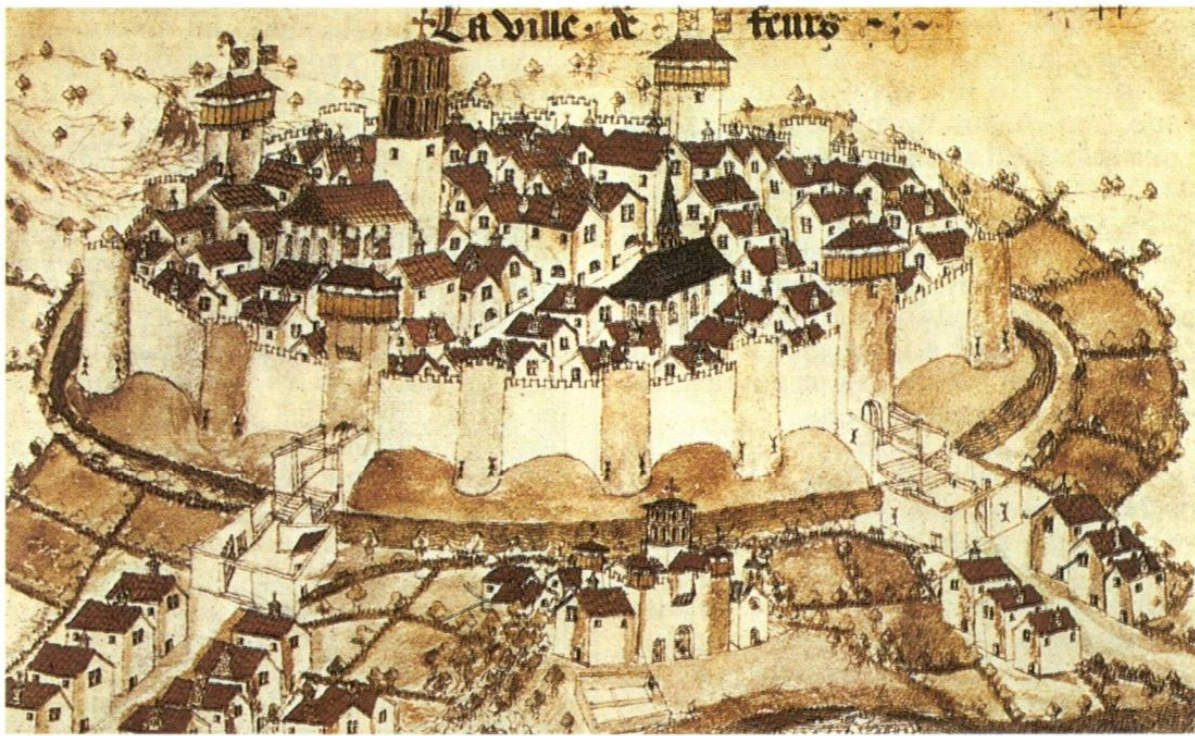
Izquierda, moneda acuñada durante el reinado de Pipino el Breve; arriba, Fleury, ciudad bajomedieval fortificada (miniatura, Biblioteca Nacional, París)

cluso político. Es el embrión de una nueva aristocracia claramente diferenciada de la vieja aristocracia senatorial romana.