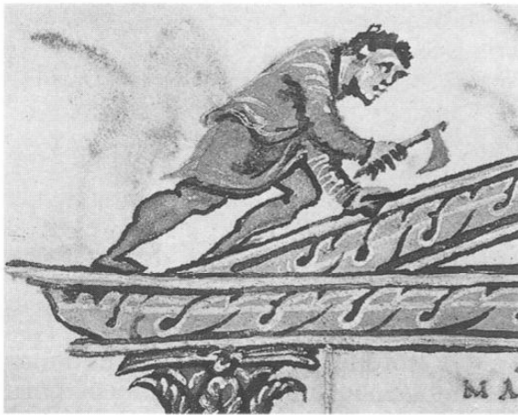
Carpintero bajomedieval trabajando en un tejado (detalle de un canon de los Evangelios de Eblon , Biblioteca Municipal de Epernay)

A partir de mediados del siglo VIII se inicia un lento proceso de colonización en los territorios septentrionales de la Península protagonizado por cántabros y vascones en la mitad occiden-