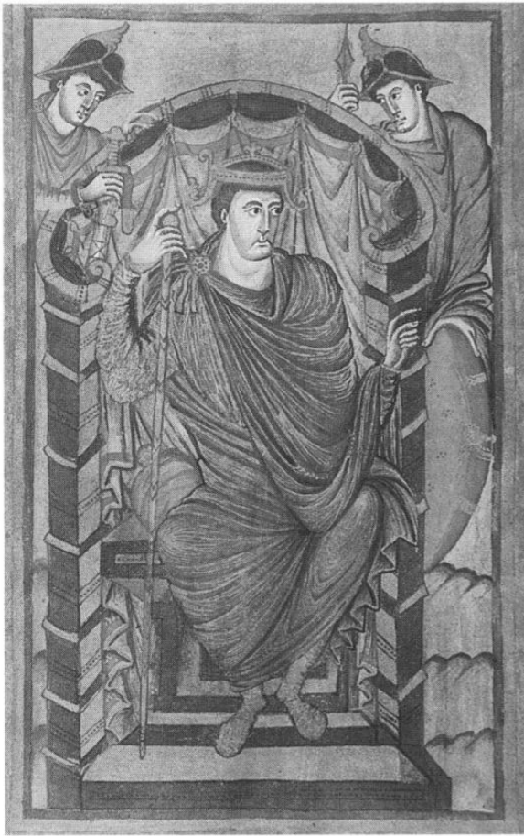
Arriba, Lotario I (miniatura del Evangelio de Lotario , siglo IX). Abajo, Carlos el Calvo (miniatura del Psalterio de Carlos el Calvo . Ambas obras se hallan en la Biblioteca Nacional de París.