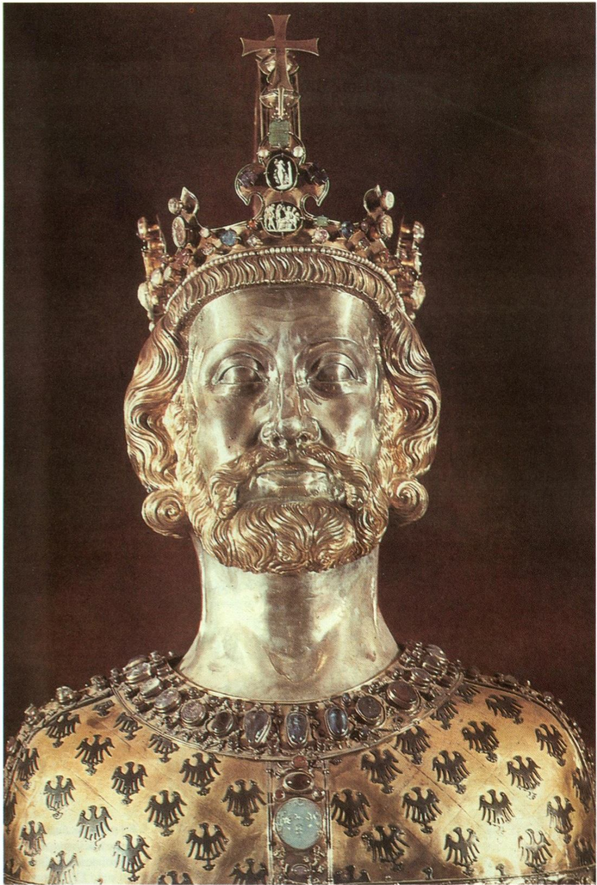
Busto de Carlomagno, fundido en el siglo XIV para contener un fragmento de su cráneo