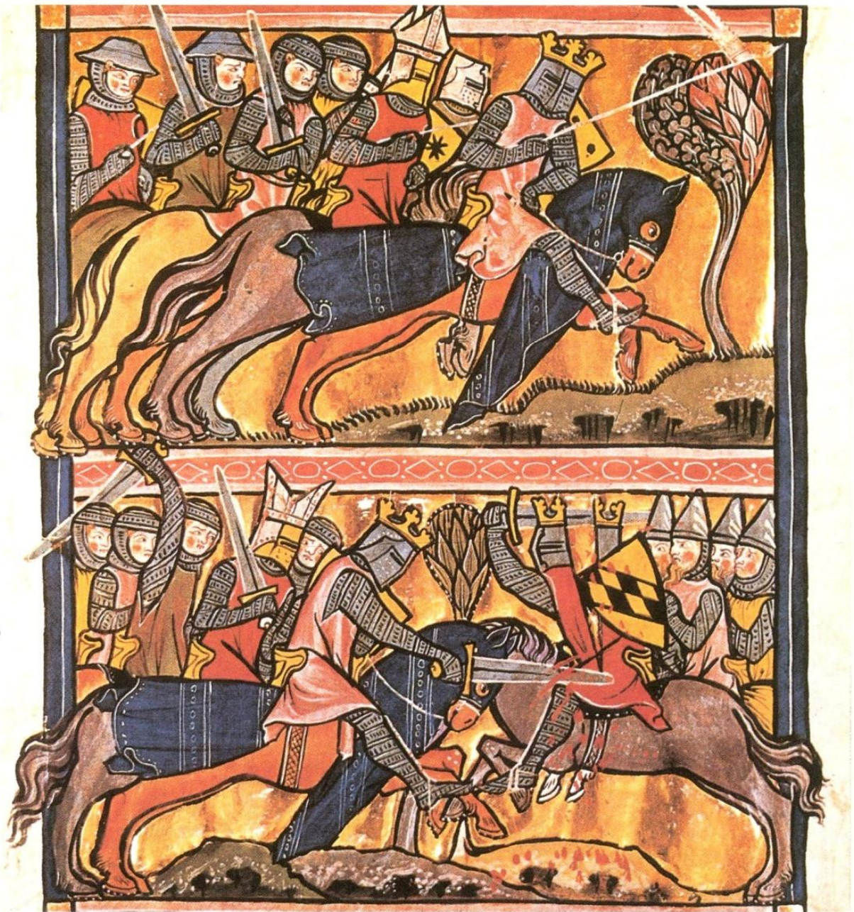
Batallas de Carlomagno (miniatura de Vita Caroli Magni , siglo XIII, abadía de St. Gall)

ropa presenta un carácter multiforme, aglutinando motivaciones de variada índole, tanto militares como políticas y económicas.