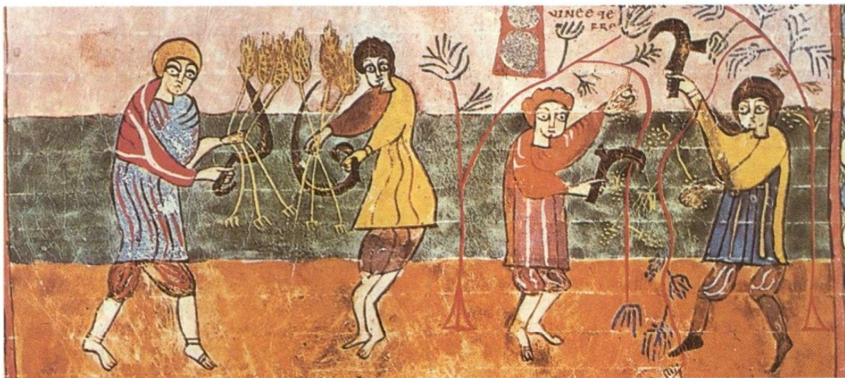
Campeñinos bajomedievales (miniatura del Beato de Valcavado , siglo IX, Biblioteca de la Universidad de Valladolid)

mirse en dos hechos que ilustran una ruptura respecto de la organización productiva esclavista; ruptura económica que, por sus características y dimensiones, hay que relacionar con la ruptura social a la que antes me he referido. En primer lugar, un poderoso fortalecimiento de la pequeña propiedad campesina en las comunidades aldeanas y que viene a quebrar el largo proceso de expropiación campesina que el latifundio romano venía operando desde la consolidación del esclavismo. En segundo lugar, la configuración de un nuevo tipo de gran propiedad que emerge a tenor de las luchas in-